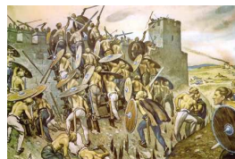
Die Schwaben stürmen ein Kastell am Limes" (19. Jahrhundert). Abb. nach einem Offsetdruck der Archäologischen Staatssammlung München. (Abb.: Römer zwischen Alpen und Nordmeer – Zivilisatorisches Erbe einer europäischen Militärmacht (Mainz 2000) Kat. 136)